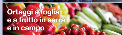
Ortaggi a foglia e a frutto in serra e in campo

3-6 applicazioni a partire da inizio sviluppo vegetativo fino alla fase di sviluppo grappolo