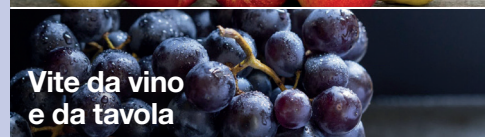
Vite da vino e da tavola

3-6 applicazioni a partire da inizio fioritura fino a 50% dello sviluppo dei frutti